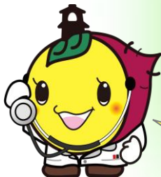
川越市マスコットキャラクター ときも